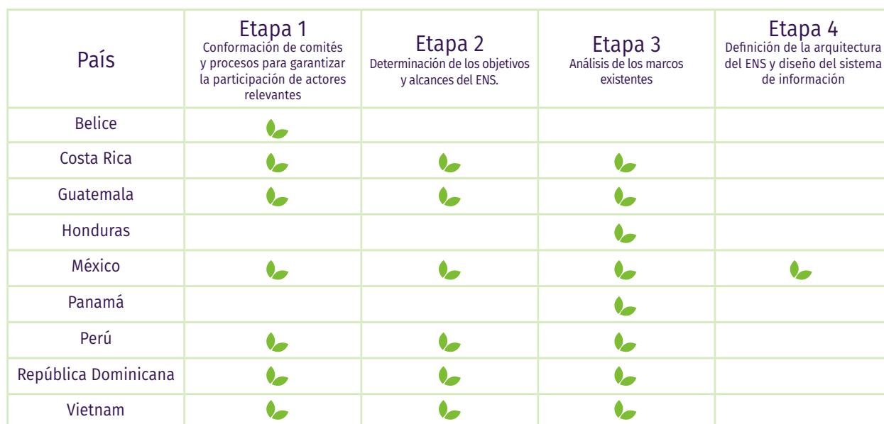
Tabla 1 Avances de países seleccionados en relación a cada una de las etapas para poner en marcha un ENS

en las sub-secciones dedicadas a examinar la etapa 4 únicamente se presentan de manera general los desafíos identificados en la planificación de dicha etapa por los países.